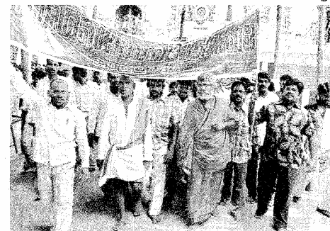
నిరసన తెలిపేందుకు వస్తున్న ఆలయ ఆస్తుల పర్యవేక్షణ కమిటీ సభ్యులు