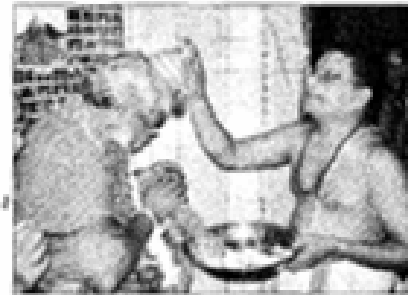
దేవాలయాల పరిరక్షణకు హిందువులందరూ ముందుకు రావలసిందిగా అందరినీ ప్రార్థించారు.